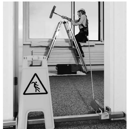
Bild 7: Die Person ist mit einem horizontal einsetzbaren Höhensicherungsgerät gesichert. Das Gerät ist an einer Traverse befestigt, die an einem sicheren Ort angeschlagen ist.