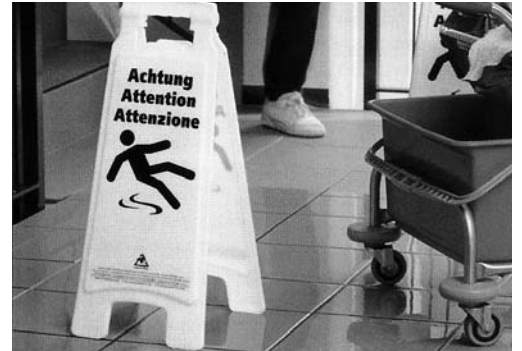
Bild 5: Signalisierung rutschiger Böden. Dieser Warnständer ist bei der Suva erhältlich (Bestell-Nr. 99103).

Siehe auch Broschüre «Gefährliche Stoffe, was man darüber wissen muss» (Bestell-Nr. 11030.d), Checkliste «Hautschutz» (Bestell-Nr. 67035.d), Film «Napo in: Vorsicht Chemikalien!» (Bestell-Nr. DVD 351).