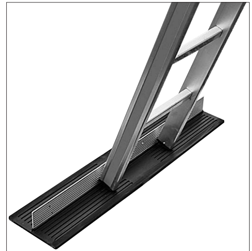
Bild 2: Durch eine geeignete Unterlage (z. B. Anti-Rutschmatte etc.) wird das Wegrutschen des Leiterfusses verhindert.