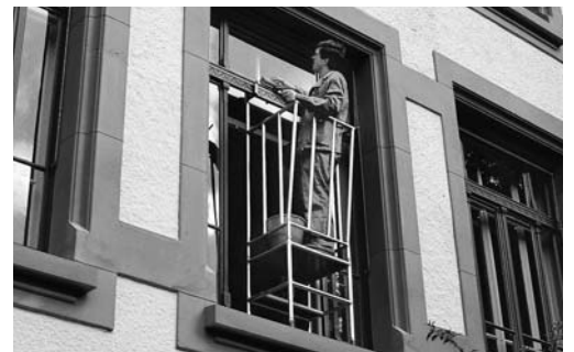
Bild 6: Schutzgeländer, das sich mit einem Griff zwischen Fenster und Fensterrahmen einhängen lässt.

Siehe auch Checklisten «Elektrohandwerkzeuge» (Bestell-Nr. 67092.d), «Elektrizität auf Baustellen» (67081.d) und «Böden» (67012.d)